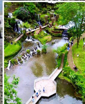
ECOPARK CURUG TILU