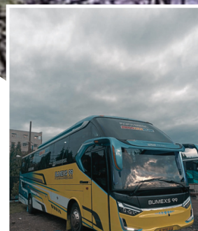
PURA ULUN DANU