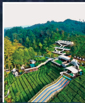
ECOPARK CURUG TILU